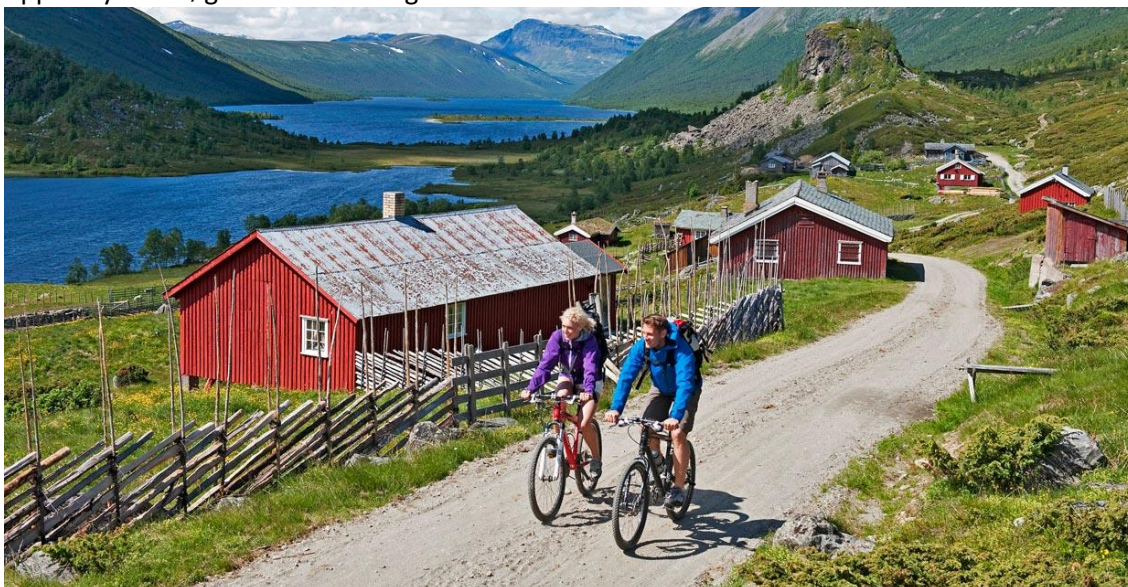
Figur 7 På Strø har stølslaget jobba mye med å ta vare på bygninger og kulturlandskap, med støtte fra Norsk Kulturminnefond

Ruta går så mot Kvitehaugen og krysser inn mot et lite stølslag Strø med utsikt innover i Helin plantepark og følger stølsvegen videre nordover langs Midtre Syndin. Derfra må det tas en avstikker opp til Syndinstøga for overnatting.