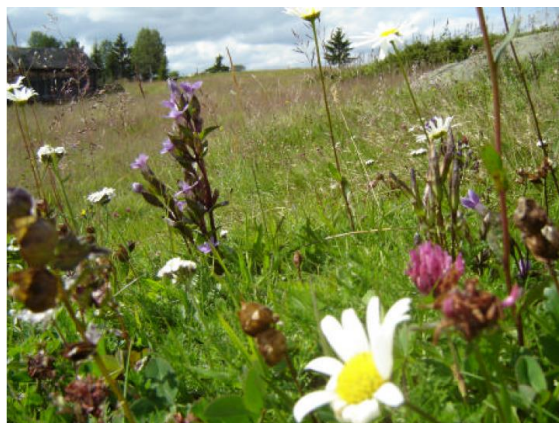
Figur 14. Høstmarinøkkel (til høyre) er freda. Foto: Thor Østbye. Til høyre bakkesøte m.m. i slåtteeng på Hermanstølen

Området i Nord-Aurdal har også gjennomgått et eget «stølsviddeprosjektet» der stølsbrukerne selv gjorde kartlegginger. I tillegg har stølsbrukerne ryddet og merket deler av den foreslåtte ruta.