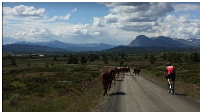
Figur 4. Mot Langestølen med åpen seter og bevertning

Fra Nøsen går turen videre nordvestover mot Jaslangen, følger så stølsvei ned i stølsområdet i Jaslangen og ned til Buaråne, der veien krysses og ruta går videre gjennom lett bjørkeskog nordover mot Matkista der det er mulighet for overnatting ei åpen fiskebu som eies av Fjellstyret i Vestre Slidre. Under Jørn Hilme stevnet i Valdres er det solefallskonsert i Jaslangen. De forrige årene har det vært artister som Ingebjørg Bratland og Odd Nordstoga.