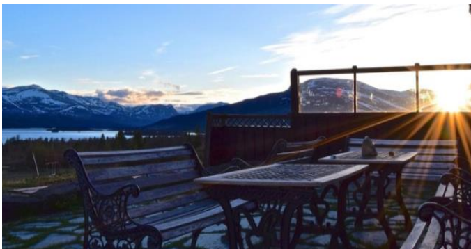
Figur 3. Nøsen Yoga og Fjellhotell

Før turen går videre kan man ta av til Langestølen og stølsbedriften i Rognåstrøe som er med i gards- og stølsnettverket i Valdres. Videre går turen via Revuren til Flyi og Nøsen Yoga og Fjellhotell der det kan overnattes.