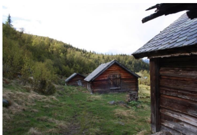
Figur 10. Hugastølen i Vang

Stien går videre på sør-vestsida av Nordre Syndin til Hugastølen i Vang. Fra Hugastølen går turen ned på buferdsvegen som ender opp ved gardstunet på Gamle Kvam og Kvamskleiva som er en del av Kongevegen over Filefjell . Denne følges kan ned til E16 og opp kulturstien til Sørre Hemsing (DNT-hytte) .