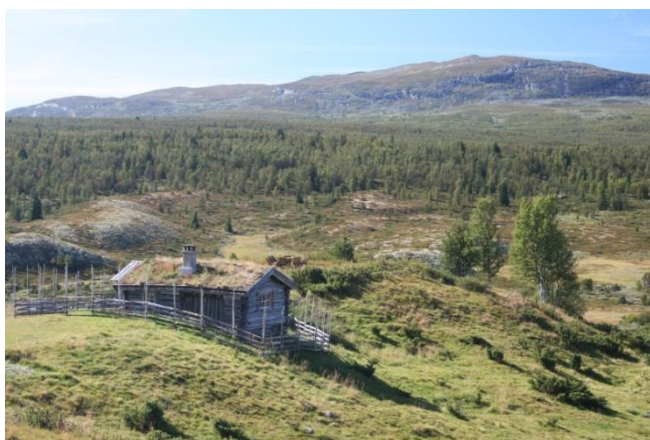
Figur 9. Langs løypa