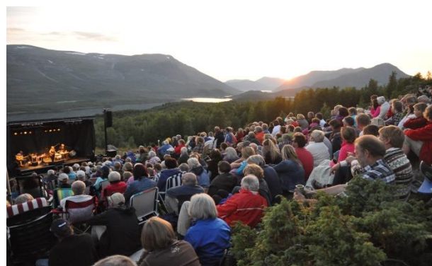
Figur 5 Solefallskonsert på Jaslangen

Ruta går så mot Kvitehaugen og krysser inn mot et lite stølslag Strø med utsikt innover i Helin plantepark og følger stølsvegen videre nordover langs Midtre Syndin. Derfra må det tas en avstikker opp til Syndinstøga for overnatting.