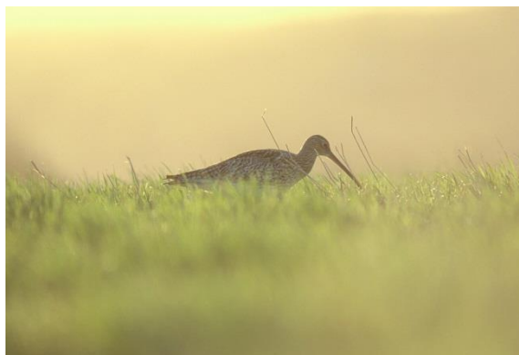
13. Ved stølslaget Gauklia er det rikt fugleliv på myrene. Storspove til høyre.

Mange av fugleartene er avhengig av åpne områder, og kombinasjon med våtmark og støling har gitt ekstra gode forhold for arter som trenger åpne, næringsrike områder. Eksempler på våtmarksarter som er knytta til kulturlandskapet er for eksempel er storspove.