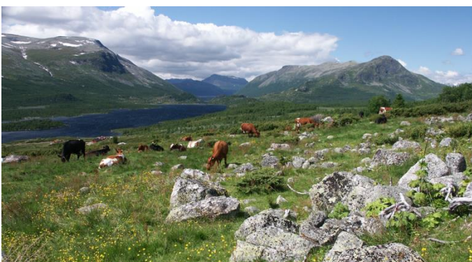
Figur 6. Fra Jaslangen. Vandreruta går på venstre side av vannet

Fra Nøsen går turen videre nordvestover mot Jaslangen, følger så stølsvei ned i stølsområdet i Jaslangen og ned til Buaråne, der veien krysses og ruta går videre gjennom lett bjørkeskog nordover mot Matkista der det er mulighet for overnatting ei åpen fiskebu som eies av Fjellstyret i Vestre Slidre. Under Jørn Hilme stevnet i Valdres er det solefallskonsert i Jaslangen. De forrige årene har det vært artister som Ingebjørg Bratland og Odd Nordstoga.