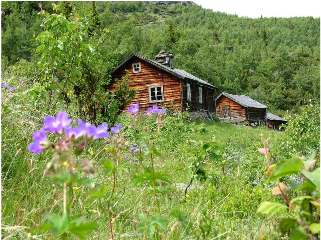
Figur 15 Øylosælet på Hugastølen