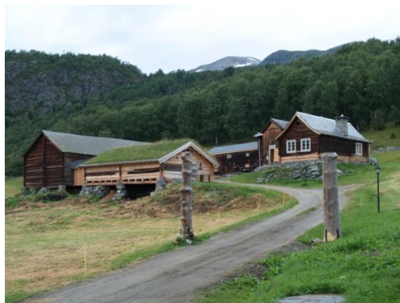
Figur 11 Ruta går siste kilometerne på Kvamskleiva, Den Bergenske Kongevegen Figur 12. Sørre Hemsing