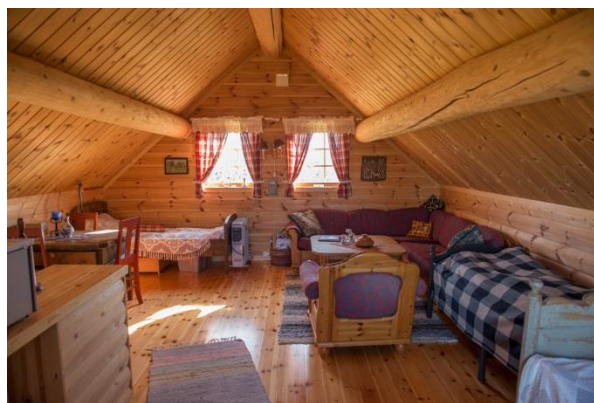
Figur 2 Overnattingsbu på Tyrishølt