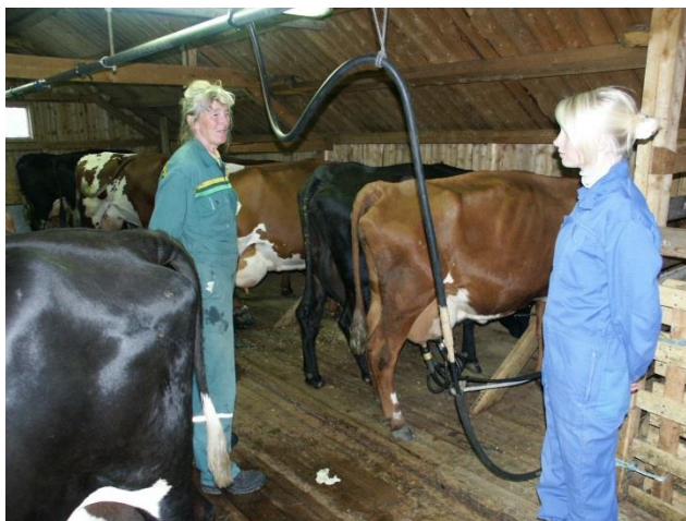
Figur 1 Vestre Slidre er det hele 42 støler i drift

Styret i Valdres Natur- og Kulturpark (6 ordførere + 2 fra Oppland fylkeskommune) er informert om arbeidet med å etablere en Historisk vandrerute på Stølsvidda i Valdres.