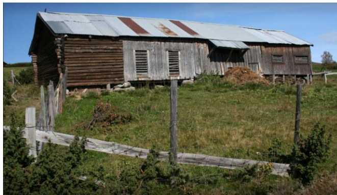
Figur 8. På Nørre Trøllhøvd selges stølsprodukter. Her driver Vikabråten gardsmat på gamlemåten med hest og håndmelking